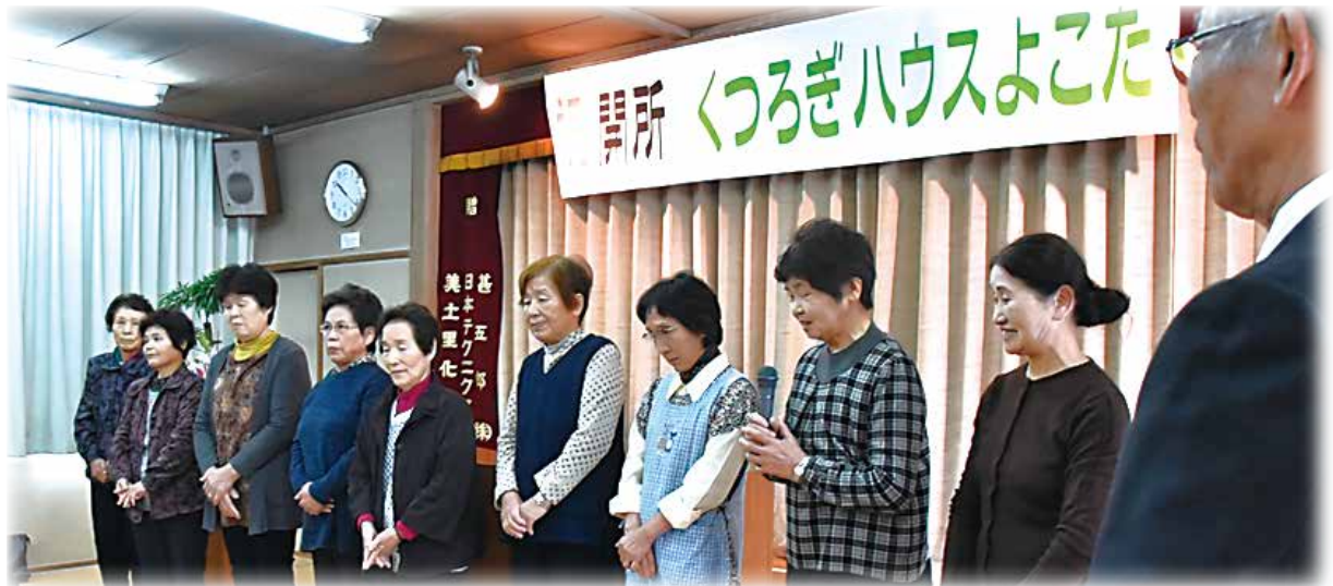
（運営ボランティアの皆さん）