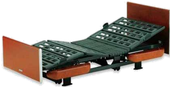
特殊寝台 (介護用ベッド)