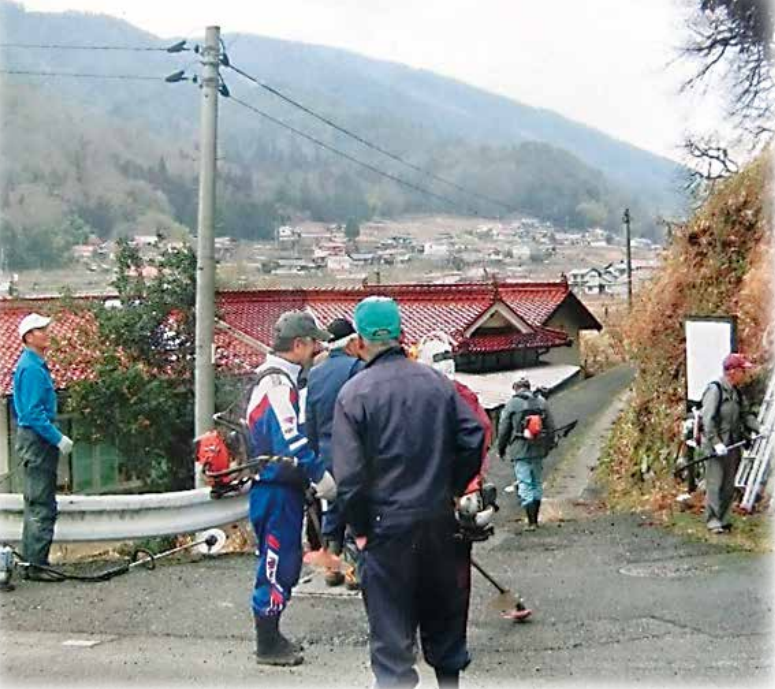
駐車場付近の草刈り

今年度は4団体から申請があり、グラウンドゴルフ場の整備・清掃や小学校周辺の自然遊歩道の環境整備、三世代交流を目的とした花壇の整備等の活動に地域助成金を活用していただいております。