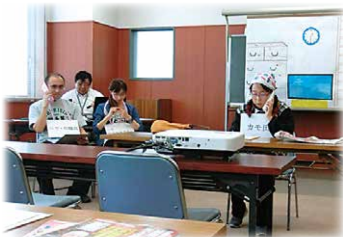
消費者被害防止に関する寸劇