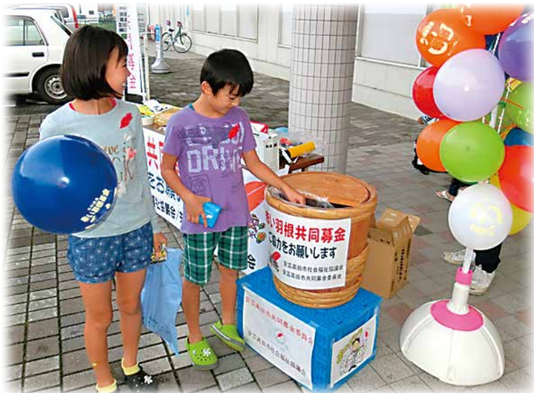
街頭募金（ゆめタウン吉田店前）

今回お寄せいただいた募金は、広島県共同募金会に全額送金しますが、募金額の約30%は県内での様々な福祉活動に、約70%が安芸高田市共同募金委員会に配分され、地域助成事業、ふれあいサロン事業、成年後見事業、配食サービス事業等に活用させていただきます。 引き続き、市民の皆さまからのあたたかいご支援ご協力をよろしくお願い申し上げます。