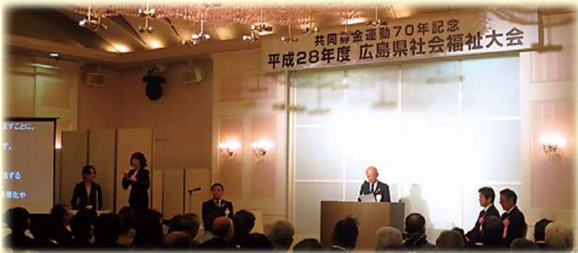
広島県社会福祉大会において表彰式が執り行われました