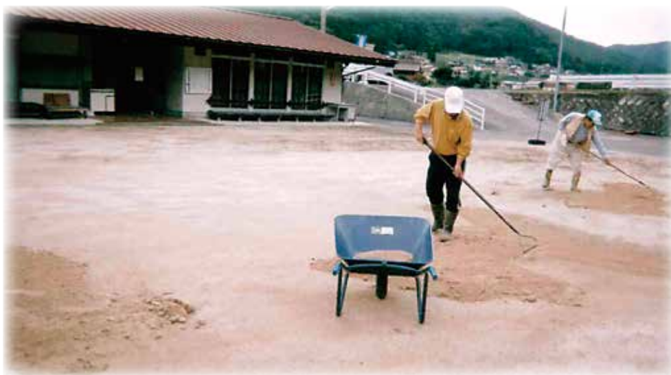
グラウンド整備（水たまりに砂を入れる作業）

行なうよう計画されています。今回の作業のように、より一層絆を深めていただけないかと思っております。