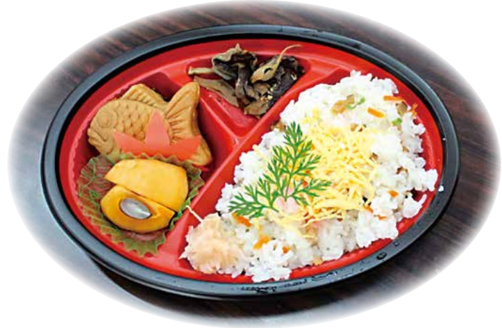
(食材を持ち寄って作る昼食)

このような課題は、美土里町横田地区においても同じで、高齢者が自宅に引きこもっていたり、認知症高齢者が近隣の知人宅を頻繁に訪問したりする状況がありました。